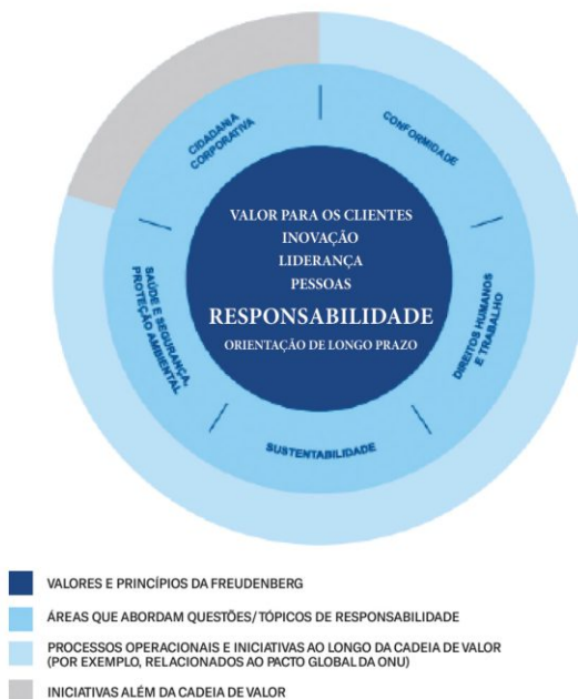
F-1 A responsabilidade Freudenberg Estrutura

Como parte de seu compromisso com a proteção do meio ambiente, a Freudenberg faz parte do Pacto Global da ONU desde 2014.